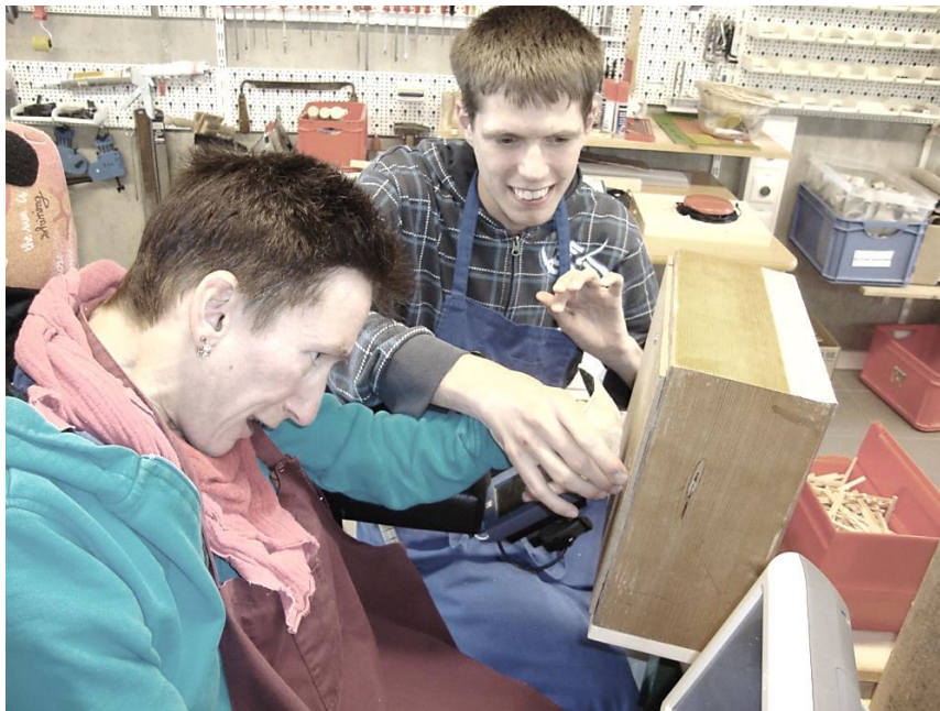
Teamwork bringt uns weiter.

Beiträge und Spenden ermöglichen es uns, innovativ und im Interesse der Menschen mit Beeinträchtigungen Projekte umzusetzen und die Lebensqualität der Bewohnerinnen und Bewohner individuell zu steigern. Dies können wir nur dank der Unterstützung privater Hilfe.