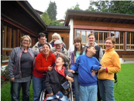
Finanzierung von Ferienwochen mit Spendengeldern

Besondere Dienstleistungen werden mit Spendengeldern finanziert. Viele kleine, mittlere und grosse Spenden ermöglichen es uns, den Bewohnerinnen und Bewohnern den Alltag zu bereichern. Wir finanzieren mit Spendengeldern Ausflüge, Ferien- und Projektwochen, spezielle Geräte, Kommunikationshilfen und vieles mehr: