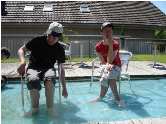
Gestaltung des Innenhofs